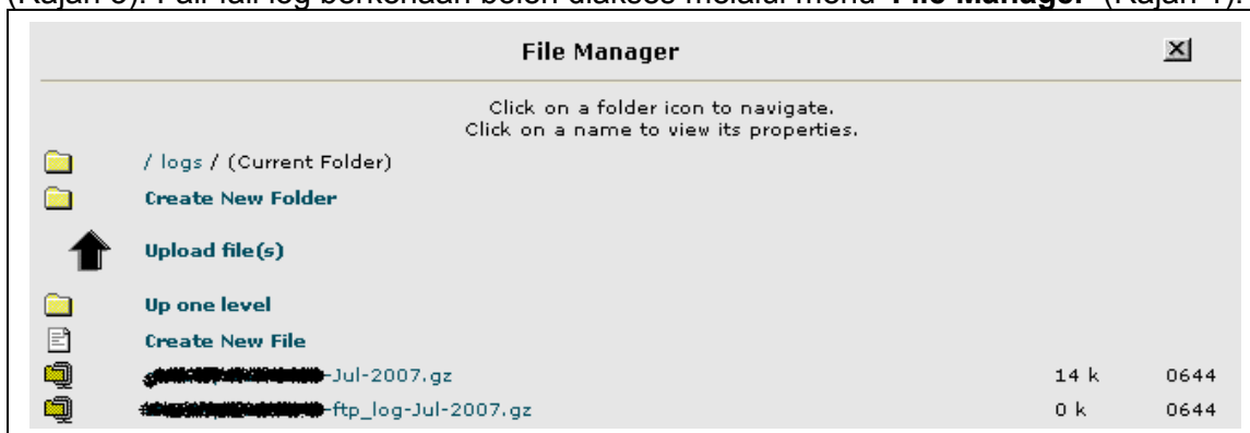
Rajah 3 : Senarai Fail Log

3. Semua fail-fail log bagi akaun web hosting berkenaan akan disimpan di folder /logs (Rajah 3). Fail-fail log berkenaan boleh diakses melalui menu 'File Manager' (Rajah 1).